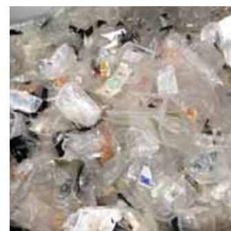
Výstupný materiál - vytriedený plast